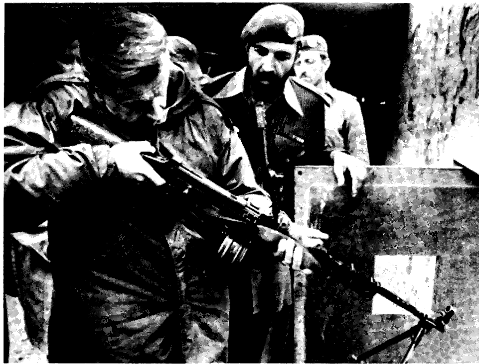
Passé de Khyber : Brzezinski visant l'Afghanistan. Ce que l'OCI et la LCI veulent cacher : l'impérialisme américain avec les mullahs contre l'Armée rouge