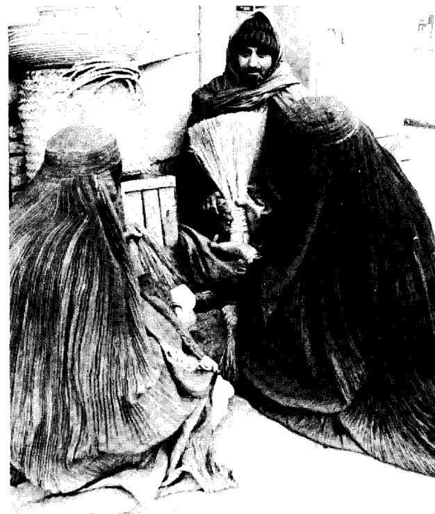
A bas la réaction islamique: Etendez les acquis sociaux d'Octobre aux peuples afghans!

En comparaison avec les explications torturées du SU, la position de l'OCI (et dans son sillon celle de la LCI) est ouvertement contre-révolutionnaire. Pour les lambertistes tout est très simple. L'URSS n'intervient que pour écraser les révolutions, n'est-ce pas? C'est donc pour écraser la révolution afghane qu'elle intervient. Même si les soldats de cette "révolution" se font prendre en photo au côté de Zbigniew Brzezinski avec le dernier arrivage d'armes automatiques américaines. L'OCI a choisi son camp dans ce conflit militaire. Et elle est du même côté des barricades que les mullahs afghans et la CIA. L'OCI ne