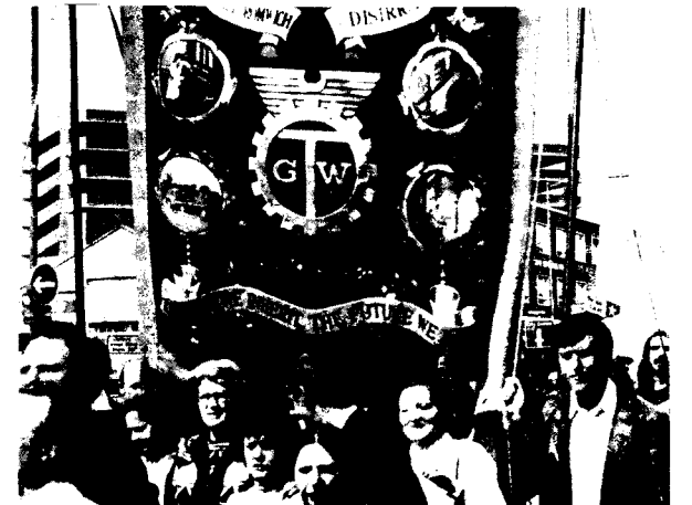
Été 1979 : Manifestation en solidarité à la grève. Thornett travaille !

Depuis sa fondation, la WSL n'a cessé de se vanter