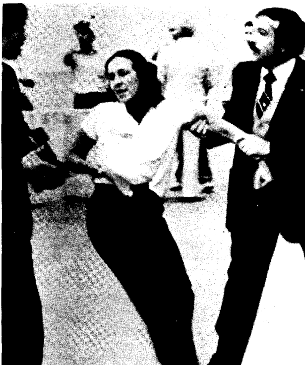
en P. T. S. NAC.