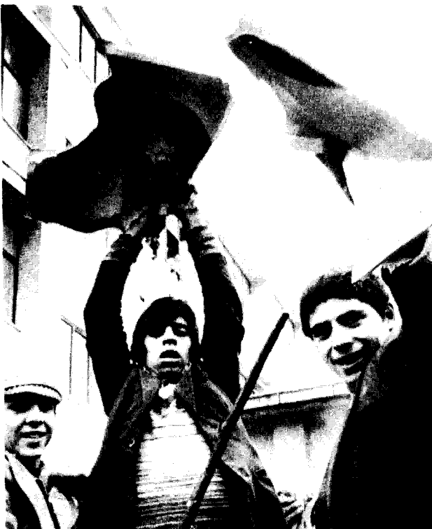
Manifestants azerbaidjanais le 6 janvier à Tabriz. Les trotskystes disent : A bas tous les ayatollahs ! Soutien militaire aux minorités nationales opprimées !

Ce n'est pas l'intervention soviétique en Afghanistan qui les a forcés à faire un choix entre l'impérialisme et le "communisme athée". Les liens entre le clergé chi'ite et la CIA remontent au moins jusqu'à 1953, où ils s'étaient associés dans le coup d'Etat qui visait à liquider le nationaliste bourgeois timoré Mossadegh pour rétablir le gouvernement du chah. Mossadegh proposait en effet des réformes telles que l'extension du droit de vote aux femmes, un assouplissement des lois sur la vente d'alcool, une réforme