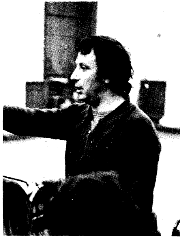
Thornett le jaune.

Nous reproduisons ci-dessous un document distribué par la FL lors de la préconférence internationale organisée en décembre 1979 par la WSL dans le but de constituer le Comité de liaison trotskyste international (pour la reconstruction de la Quatrième Internationale).