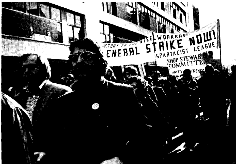
Manifestation des sidérurgistes à Sheffield le 18 février

le plus haut degré d'unité. Il faut forcer le TUC à appeler à une grève générale nationale immédiate et illimitée autour des objectifs de revenir sur les licenciements, les attaques contre les syndicats, les réductions des services sociaux, et de gagner une échelle mobile des salaires et des retraites comme protection contre l'inflation, et la répartition du travail entre tous à plein salaire! Il est nécessaire d'écraser le programme anti-ouvrier des Tories et le gouvernement détesté de Thatcher. Ainsi, une grève générale victorieuse, même en débutant sur des buts défensifs nécessairement limités, pourrait ouvrir une