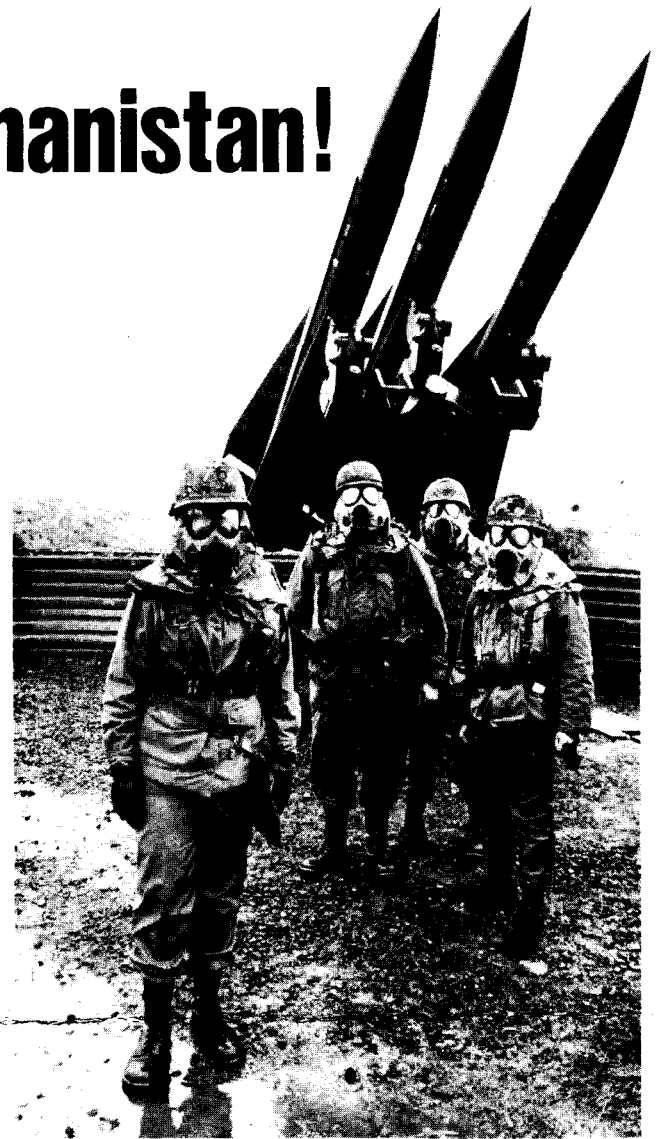
Missiles américains en RFA, pointés vers l'Est.

Les occidentaux aimeraient bien que l'Afghanistan devienne "le Vietnam de l'URSS", mais les forces armées soviétiques sont parfaitement capables de venir à bout de cette rébellion désorganisée et mal armée. Qu'advient-il alors du pays? En l'absence de ne serait-ce qu'un prolétariat des plus rudimentaires, les ingrédients essentiels pour la libération des peuples afghans doivent provenir de l'extérieur de cette région où c'est le mode tribal qui domine. Si le pays est effectivement incorporé au